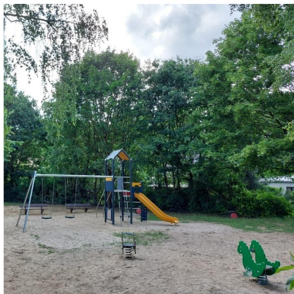
Die Installation des Spielhauses mit Rutsche auf dem Spielplatz am Lindenzentrum

Bei der dritten Auflage des Bürger:innenhaushaltes in 2022 stimmten 181 Einwohnerinnen und Einwohnern der Fontanestadt Neuruppin ab. Diesmal war die Anschaffung eines Spielhauses für den Spielplatz am Haselnussweg im Lindenzentrum der meistgewählte Vorschlag der Teilnehmenden. Dieses Projekt erhielt 42 der abgegebenen Stimmen. Danach folgten mit 31 bzw. 27 Stimmen die Sanierung eines Spielplatzes am Treskower Ring sowie die Erweiterung des Spielplatzes an der Turnhalle in Gildenhall auf den weiteren Plätzen. Einen kurzen Eindruck der bestplatzierten Projekte sowie einen Überblick über die Abstimmung erhalten Sie im Folgenden: