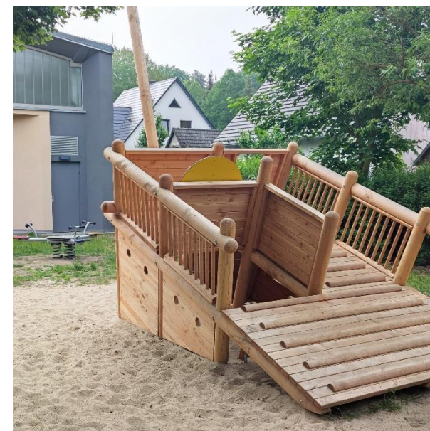
Das Kletterschiff auf dem Spielplatz an der Turnhalle Gildenhall lädt zum Spielen ein